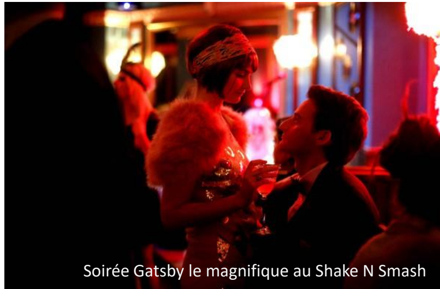
Soirée Gatsby le magnifique au Shake N Smash